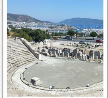
Bodrum Antik Tiyatro

Karya hükümdarı Mausolos için MÖ 350'de yapılmış büyük bir mezarıdır. Mermer yapısı o kadar muazzam ve süs heykelleri o kadar çarpıcıydı ki Antik Dünyanın Yedi Harikası listesine girdi. İsmindeki "moza", daha sonraki herhangi bir büyük anıt mezara verilen isim oldu. Birebir örneği Bodrum Hotel & SPA lobisinde sergilenmektedir.