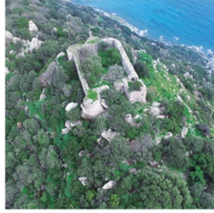
Aspat Kalesi (Çıfıt Kalesi)

Bodrum'daki yel değirmenleri ilk defa 1850'li yıllarda, bol rüzgâr alan tepelerde yapılmıştır.