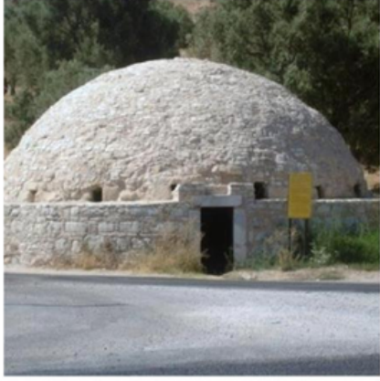
Tarihi Su Sarnıçları