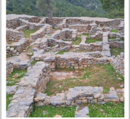
Pedasa Antik Kenti

Kral Mausolos tarafından yaptırılmış olan Myndos Kapısı, Bodrum merkez ile Gümbet arasında yer alıyor, Bodrum tarihi yerleri açısından da çok önemli bir yere sahip yapılarından biri. Büyük İskender'in geçemediği kapı olarak da anılır.